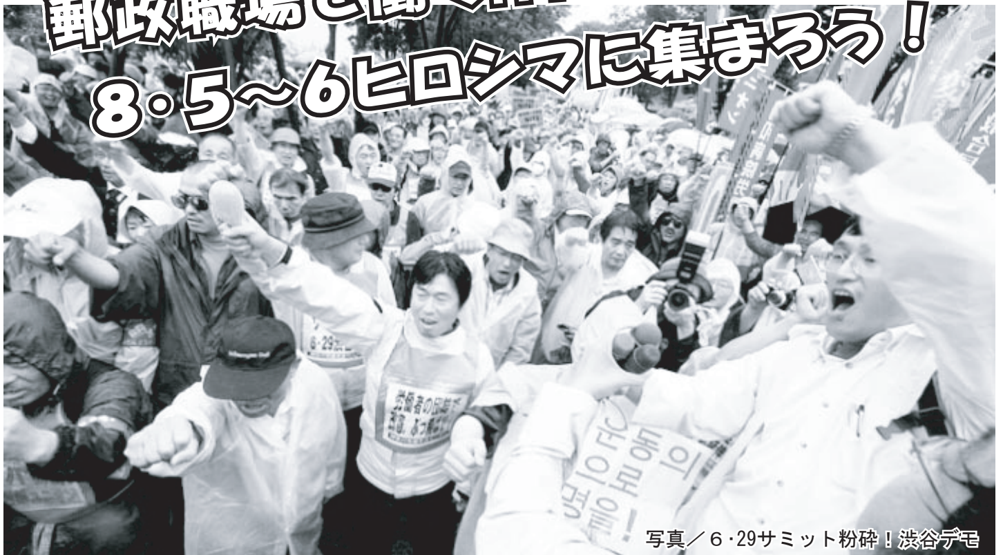
写真／6・29サミット粉碎！渋谷デモ