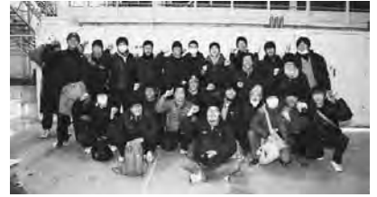
ろう城を解くにあたり最後の写真を撮る第1工場組合員

本書は、25日の描写の折に触れ、こうした非正規職増加の背景や、全国の非正規職闘争の歴史を説き起こす。