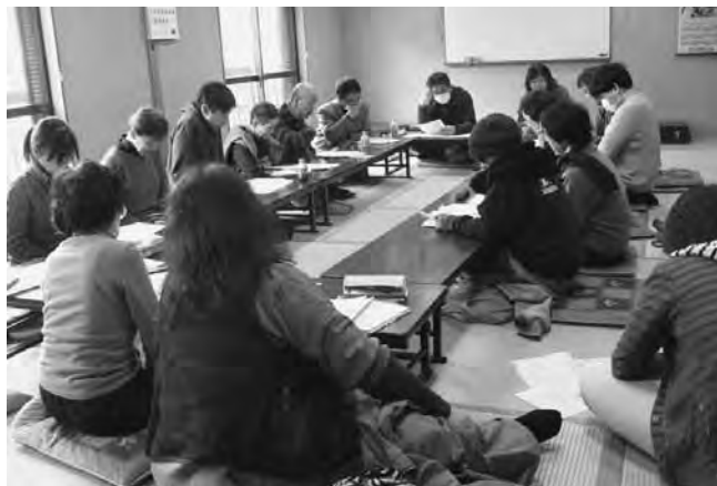
医療福祉労働者部会首都圏学習交流会（1月26日）

「ヘルパーがやってはいけない（やらなくてよい）医療行為をしてしまった」「標準作業時間を超えてしまい、他の職員に迷惑をかけたことが就業規則違反（職員の心得）として処分の対象になった」「入浴介助で、汗を手で拭いて、その手で利用者のタオルに触れたことが問題に」「組合を作って不払い残業代を請求したら、セクハラを