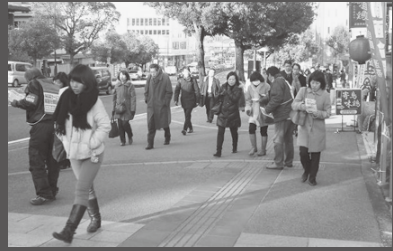
奈良地方裁判所前で抗議（2月12日）