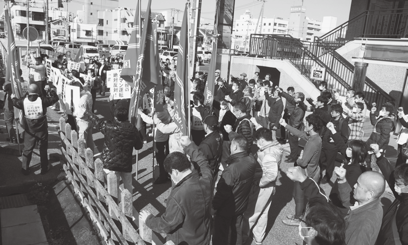
動労千葉、木更津総行動に 150 人。動労千葉は春闘第 2 波、3・14～17 連続ストライキを打ち抜いた。(3月16日 千葉・木更津運輸区門前)