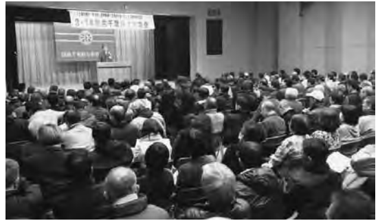
ストライキ突入！ 3・14 動労千葉 総決起集会に310人（千葉市民会館）

2月24日の動労千葉定期委員会で田中康宏委員長は「外注化がもたらすデタラメさに絶対に慣れてはならない」と何度も強調しました。こういう現場での執念が上記のような36協定をめぐる闘争として結実したのです。外注化の非合理・デタラメさと一つひとつ現場から対決する闘いを開始する中で打ち立てた3月ストライキです。