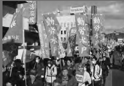
労働者組合旗を林立させてデモ