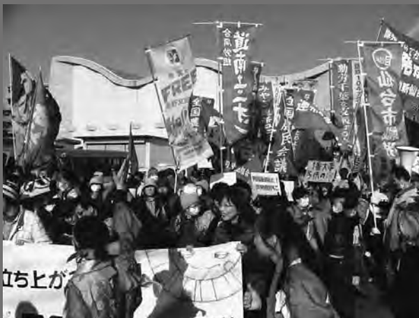
いよいよ福島市内デモに出発

3・11から2年、福島県教育会館大ホール（福島市）において「3・11反原発福島行動'13」が1350人の結集で闘われました。労組交流センターもフクシマの怒りと連帯し、組合旗を林立させ、再稼働阻止へ共に闘い抜きました。