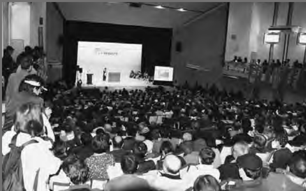
会場あふれる1350人の結集（福島県教育会館大ホール）