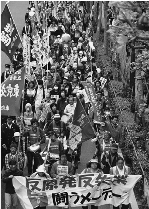
「反原発・反失業メーデー」 520人 が芝公園からデモ（5月1日 東京）

てきたからでしょうが、しかし、結合とはデモに組合旗をもって参加することだけではありません。全国のあらゆる職場で動労千葉の反合・運転保安（安全）闘争を巻き起こすのです。医療職場なら、それは「人員増」、しかも職場に定着できる「正規職」の要求です。いたる所で安全を求めて闘う先に、「原発推進」の国策をその根幹で打ち砕く力がくれるのだと思います。フクシマは「第3の原爆」という事態です。ノーモアヒバクシャ！ この反核運動の原点から、核兵器だけでなく、原発にもNOというのが、今年の8・6〜9の闘いです。職場で「安全」を闘って、職場の仲間と共に「ヒロシマ大行動」に大結集して、歴史的な反核運動を展開しよう。そして、反原発で立ち上がり始めた広範な人々と結びついて、労働組合の力を示していきたいでしょう。