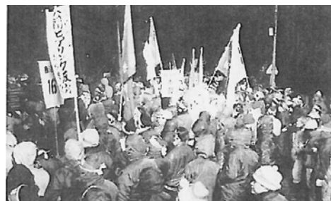
島根原発2号機公開ヒアリング阻止闘争（1981年1月27～28日）。徹夜闘争に6000人が結集

た。1981～83年にはレーガンの核戦争政策に対して全世界の労働者階級人民が空前の反核闘争に立ち上がった。そして1986年にはチェルノブイリ原発事故が起きる。電産中国の「反原発労働運動」は、圧倒的な階級的大義性をもって、新自由主義の下で原発政策を進める中曾根ら日本帝国主義・電力資本を決定的に追い詰めていくことができたはずなのである。だが、現実にはそうならなかった。それどころか逆に電産中国は、原発政策の先兵となった連合・電力総連に吸収されて、解体されていくのである。いま全原発の停止・廃止へ向かって、