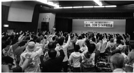
「復帰」39年5・14沖縄集会に350人（5月14日 那覇市民会館ホール）

進めるのかを全ての知恵と力を 使って言わなければならぬ。 そこまで来たということです。 職場でここを言わなきゃいけ ない。こうやって闘っていけば、 この社会のあり方を変えられる んだ、変える力を持っているん だ。それは職場で起きている具 体的なひとつひとつの理不尽に 対する労働者の怒りの声を具体 的な運動にして、それが職場の 労働者の支持を得て団結につな がっていく。労働者が自ら行う 運動なわけじゃないですか。自 ら運動をしたときにこの社会が 変えられるという、つまりひと