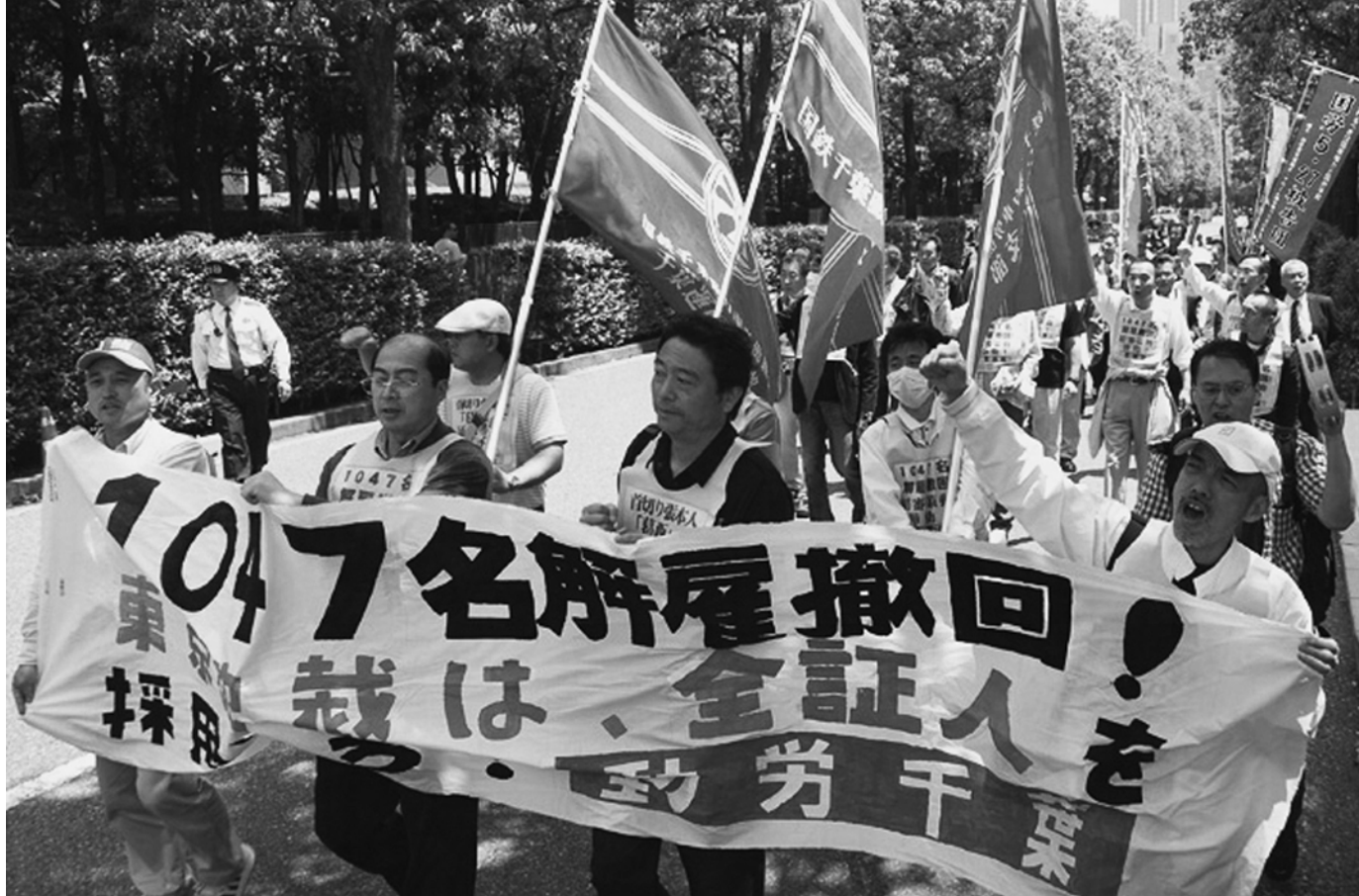
動労千葉鉄建公団訴訟、問答無用の結審策動を徹底弾劾（5月18日 東京地裁包囲デモ）