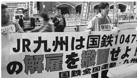
九州電力への抗議行動後、JR九州本社前 抗議行動を闘いぬく(4月1日 博多駅前)