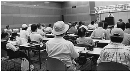
2010年6・27 結成集会 (小倉 商工貿易会館大ホール)