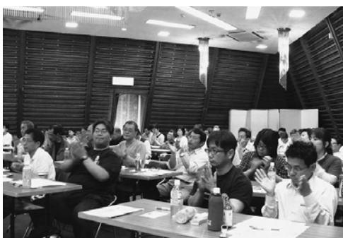
実践集団・組織集団への変革を決意

●神奈川 求められているのは組織拡大。相模原選挙の教訓。階級の中に入り怒りを組織する闘いだ。団結を勝ちとれた選挙だった。湘北は相模原で合