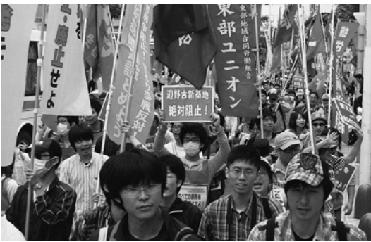
350人が那覇・国際通りをデモ（5月14日）

「デモに行きたい」という若者の意識の変化を僕らが捉えられるか。これは3・11前と比べたら労働者の意識の巨大な変化です。この変化に僕らが食らいついて闘う。これは怒りじゃないですか。あるいは未来を奪わ