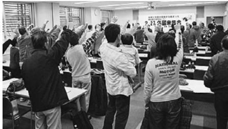
2・27 久留米集会 (久留米)