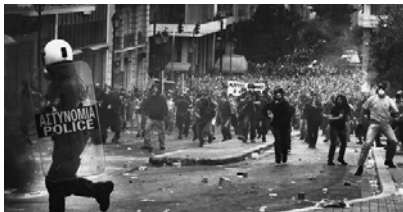
ギリシャの暴動闘争（2010年5月）

く。間違いなくそうなる。第2次復興予算を簡単に組めないと言っている。あれが組めないのははつきりしています。次は復興国債を発行しなかつたら財源がない。では復興国債を発行したらどうなるのかということも昔なんかみんな恐れている。国債暴落の可能性が高いわけですよ。そしたらたちまちギリシャになる。ギリシャで何が起きたかはみんな知っているとおりです。日本がギリシャにならないと言っていたのは貿易黒字があるからだと言っていたわけです。貿易黒字ということは企業が貯め込んでいる。貿易しているのは企業なんだから。まだ国債を発行したって企業は引き受けてくれる。だから暴落し