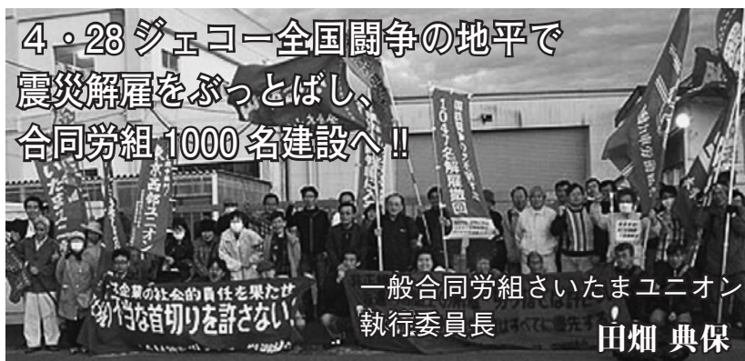
全国闘争を打ち抜いた全国の仲間（4月28日 埼玉県行田市ジェコー行田工場門前）

「ふざけるな！ 私はジェコーを絶対に許さない。解雇撤回まで徹底的にたたかうぞ！」