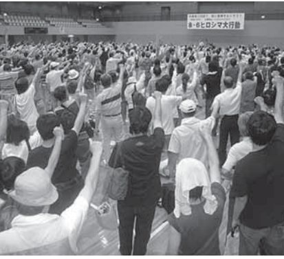
2007年8・6ヒロシマ大行動

資本主義が完全に行き詰まり、労働者の生きるための闘いが体制を根底から揺るがしています。労働者階級の団結の力で勝利する時代です。