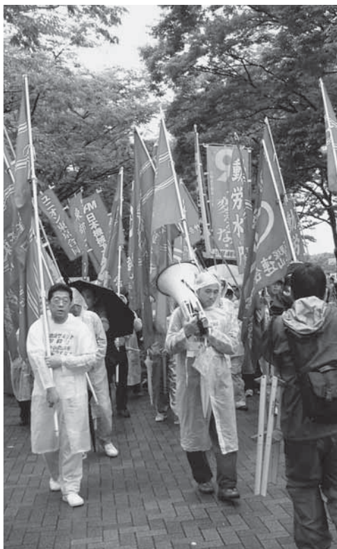
サミット粉砕6・29闘争

めたとたんに既成労組指導部は反動となり、組合員の闘いを圧殺する体制内労働組合の本性をむきだしにして襲いかかってくるのです。国労内部にもあらゆる体制内指導部の弊害が出てきています。「4者4団体」路線がそうであると同時に中央本部自身がJR資本に屈服し警察権力と一体となつて、5・27臨大闘争弾圧をかけてきたのです。国労共闘破壊の大弾圧でした。裁判闘争は次回で89回の公判になりますが、裁判官交代の更新手続きに入っています。この間、被告の要求を聞こうともしない体制内にどっぷり浸かった弁護団を全員解任し、新たな体制で裁判自体を階級裁判として再出発することが出来ました。階級的労働運動を拒否した妨害物はさげすまざりなくなり、国労の階級的再生に向かって被告、弁護団とそれを支える体制が出来つつあります。 サミット決戦を帝国主義への怒りと階級の団結で粉砕し、全世界の労働者階級と団結し権力を奪取する時が来たのです。