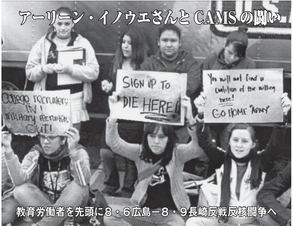
教育労働者を先頭に8・6広島-8・9長崎反戦反核闘争へ